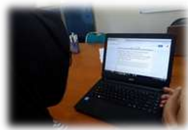
Gambar 1. Pelaksanaan kegiatan pelatihan