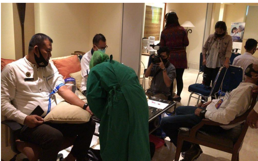
Gambar 2. Pelaksanaan Rapit Test pada Peserta