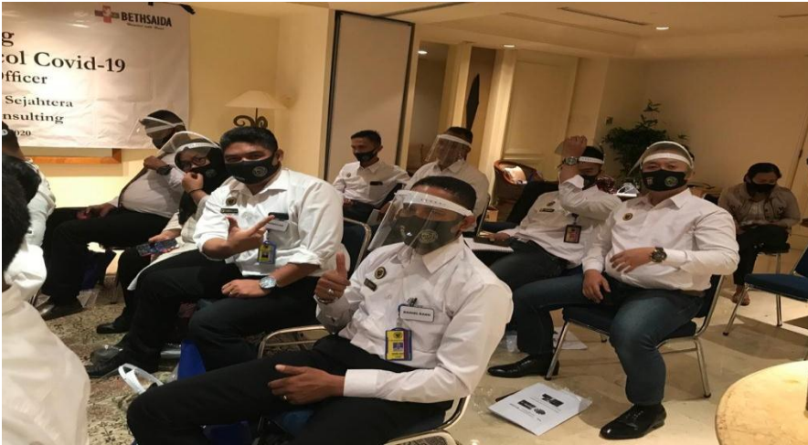
Gambar 3. Peserta Kegiatan Penyuluhan