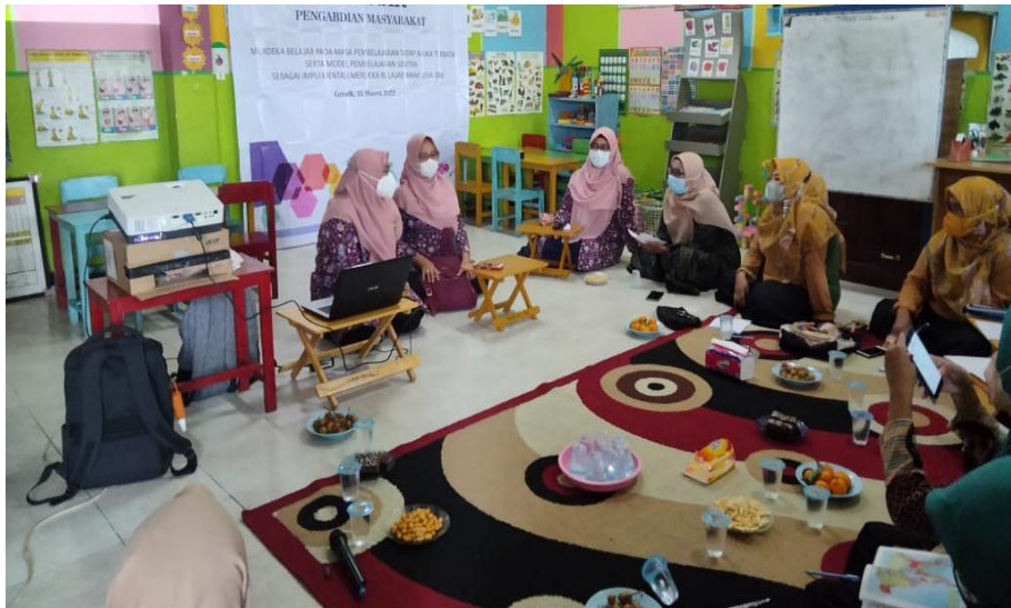
Gambar 1. Pemberian materi sosialisasi

penyesuaian jadwal antar lembaga dengan para pengisi acara, sehingga membutuhkan koordinasi yang cukup lama. Namun, secara keseluruhan pelaksanaan sosialisasi dapat dilakukan dengan lancar sesuai dengan rencana.