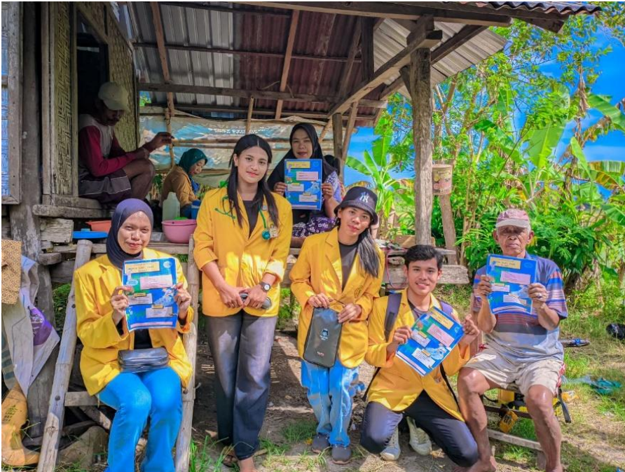
Gambar 1. Edukasi PTM

Berdasarkan Tabel 1, terjadi peningkatan pengetahuan yang signifikan. Sebelum edukasi, sebanyak 13 orang (56,9%) berada pada kategori pengetahuan kurang. Setelah edukasi, seluruh peserta (100%) berada pada kategori pengetahuan baik. Hal ini menunjukkan bahwa edukasi kesehatan yang diberikan efektif dalam meningkatkan pemahaman masyarakat mengenai bahaya dan pencegahan hipertensi.