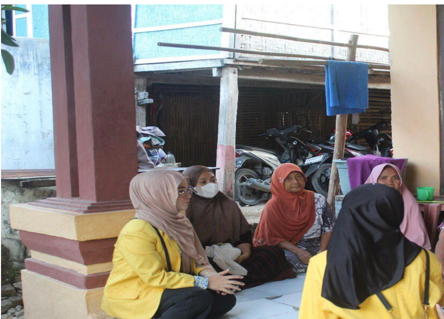
Gambar 2. Proses kegiatan tanya evaluasi kegiatan PkM

Setelah kegiatan edukasi dan tanya jawab, dilakukan pemeriksaan tekanan darah sebagai skrining awal untuk mengidentifikasi kondisi kesehatan peserta terkait hipertensi. Setiap hasil pengukuran dicatat dalam lembar observasi dan diklasifikasikan sesuai standar kategori tekanan darah. Hasil pemeriksaan tekanan darah dan usia peserta disajikan pada Tabel 2.