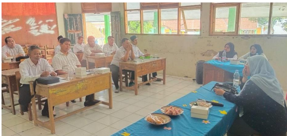
Gambar 2. Pemberian Materi

Setelah pemaparan teori, peserta diajak untuk mengikuti diskusi kelompok dan studi kasus, di mana mereka menganalisis contoh nyata siswa yang mengalami kesulitan membaca serta mendiskusikan strategi penanganan yang tepat. Selanjutnya, fasilitator memandu sesi praktik dan simulasi ( role play ), di mana peserta mempraktikkan teknik melatih artikulasi, latihan fonetik, dan penerapan metode multisensori dalam pembelajaran membaca.