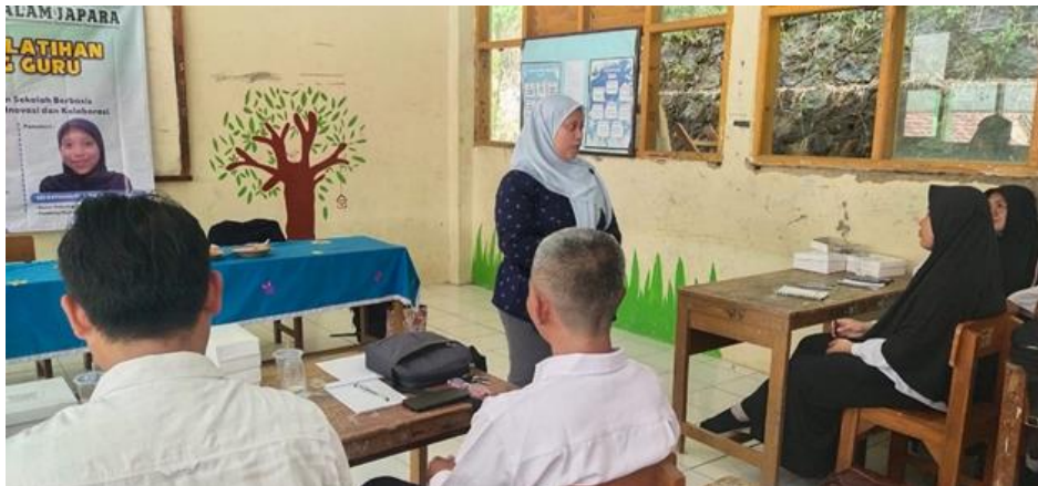
Gambar 1. Latihan "Ucap"

kemudian dilanjutkan dengan sesi penyampaian materi inti, yang meliputi konsep dasar membaca, hubungan antara artikulasi dan kesadaran fonologis dalam proses membaca, serta bentuk-bentuk kesulitan membaca yang umum terjadi di sekolah dasar dan menengah.