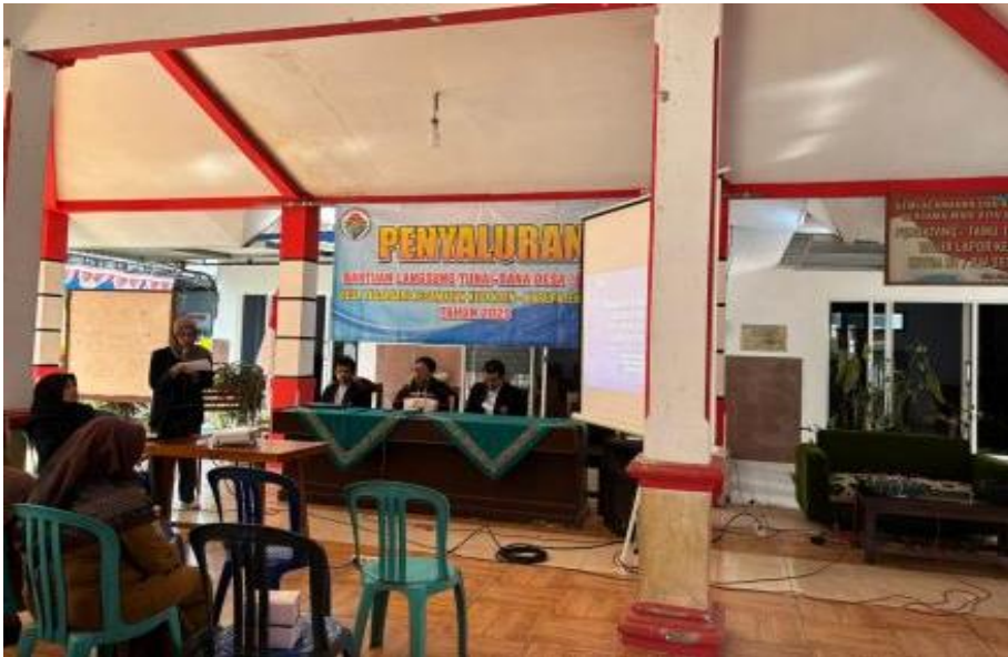
Gambar 2. Suasana Pembukaan Pelatihan Pengabdian Desa Tegalsari

Pelaksanaan kegiatan pengabdian kepada masyarakat di Desa Tegalsari, Kecamatan Kepanjen, Kabupaten Malang, pada 24 Juni 2025, berjalan dengan lancar dan sukses. Kegiatan ini bertujuan untuk memberikan pembekalan kepada warga dengan memanfaatkan potensi wisata halal Desa Tegalsari. Acara dimulai pukul 09.00 WIB di Balai Desa Tegalsari, dengan jumlah peserta 25 orang, terdiri dari perangkat desa, pelaku usaha lokal, serta perwakilan karang taruna yang memiliki pengaruh besar dalam masyarakat setempat.