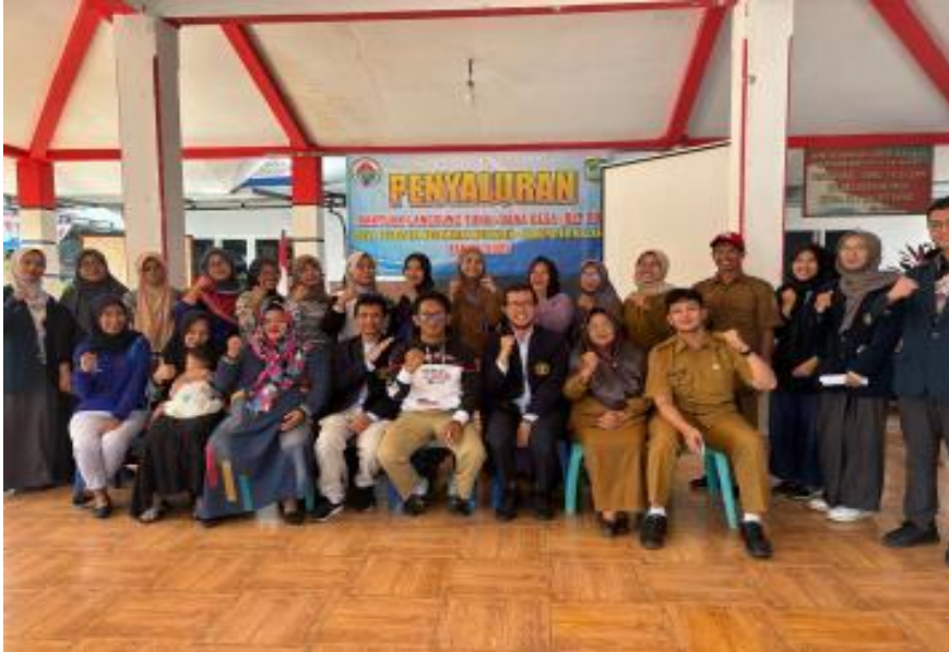
Gambar 5. Foto Bersama

Keterlibatan aktif masyarakat selama kegiatan juga mencerminkan terbentuknya modal sosial ( social capital ) yang kuat, berupa jaringan kerja sama, rasa saling percaya, serta kesadaran bersama dalam mengembangkan potensi wisata halal secara berkelanjutan. Dengan demikian, kegiatan sosialisasi ini tidak hanya bersifat informatif, tetapi juga transformatif, karena mendorong terbangunnya ekosistem pariwisata halal yang adaptif terhadap perkembangan zaman, berorientasi pada nilai-nilai keislaman, serta mampu memperkuat pertumbuhan ekonomi lokal berbasis partisipasi masyarakat.