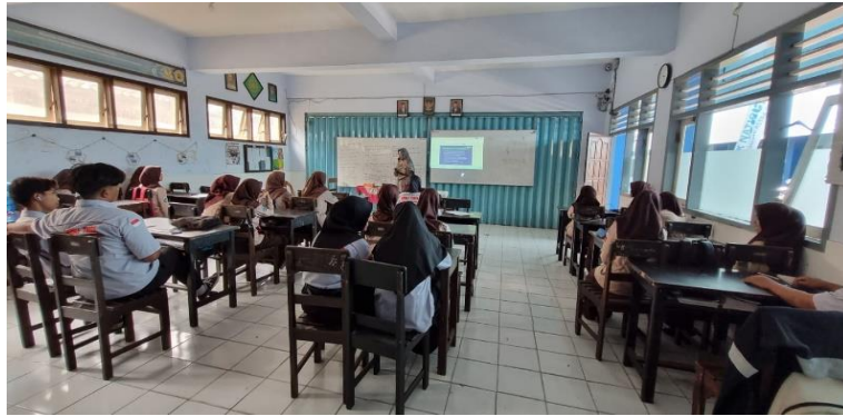
Gambar 1. Penjelasan Materi Penyuluhan

peningkatan pengetahuan sekitar 85% siswa dengan tingkat pengetahuan baik. Para peserta antusias mengikuti penyuluhan dapat dilihat dari keaktifan dalam diskusi tanya jawab. Siswa/siswi dengan aktif bediskusi masalah kenakalan remaja yang mereka temui dan sangat antusias dengan berbagai hasil diskusi atau pendapat kelompok dengan baik.