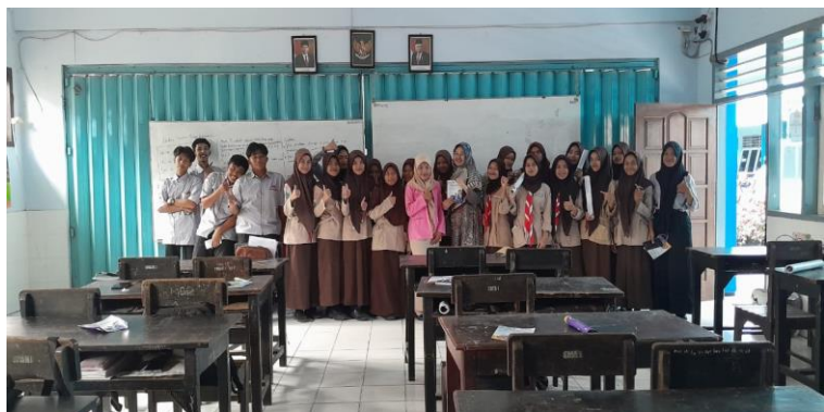
Gambar 2. Sesi Foto Bersama