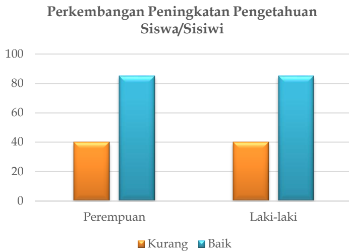
Gambar 4. Diagram Batang peningkatan pengetahuan siswa/siswi