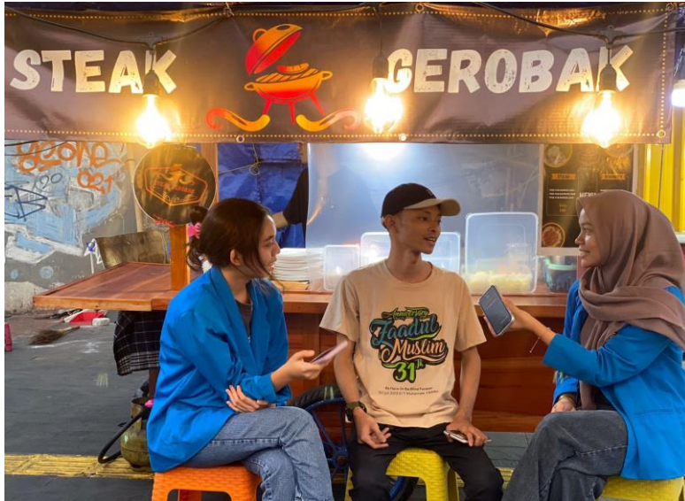
Gambar 9. Wawancara Pedagang Steak Gerobak

Setelah menyelesaikan KKN pada tanggal 17 Juli 2023, pada tanggal 21 Juli 2023, kami menjalankan kegiatan wawancara terkait Usaha Mikro, Kecil, dan Menengah (UMKM) Steak Gerobak. Wawancara ini bertujuan untuk mendapatkan informasi seputar sejarah dan perkembangan Steak Gerobak, mulai dari tahap awal pembentukannya hingga mencapai tingkat omzet yang berhasil diperoleh oleh pedagang Steak Gerobak tersebut. Tujuan dari wawancara ini adalah untuk memahami secara lebih mendalam aspek-aspek terkait operasional, strategi pemasaran, dan tantangan yang dihadapi oleh UMKM tersebut selama perjalanannya.