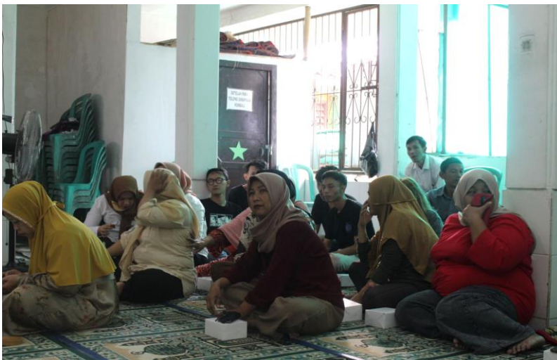
Gambar 2. Pelaksanaan KKN

Susunan acara pelatihan dimulai dengan kata sambutan oleh Ketua Pengurus Masjid, lalu pemberian cinderamata sebagai kenang kenangan kepada ketua Pembina Posdaya Kasih Ibu dan Ketua pengurus masjid, Acara selanjutnya materi inti yaitu pembukuan Keuangan Berbasis handphone bagi UMKM binaan Posdaya Kasih Ibu, peserta KKN ini melibatkan pelaku UMKM dibawa binaan Posdaya Kasih Ibu, pelaku UMKM ini bermayoritas Ibu Rumah Tangga.