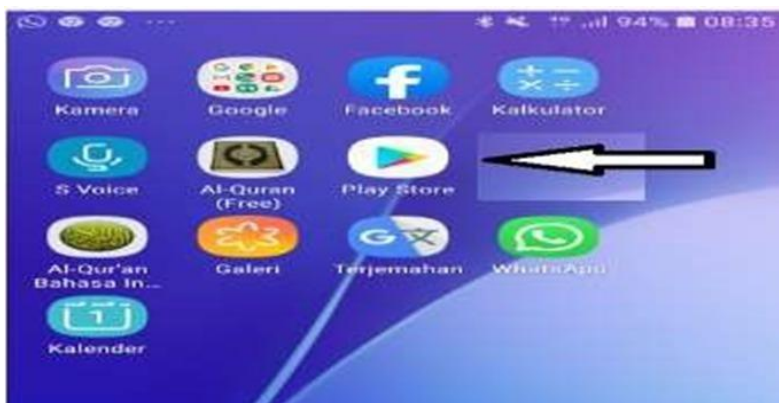
Gambar 4. Install Aplikasi Akuntansi UKM

Pimpinan Posdaya Kasih Ibu mengungkapkan kegembiraannya atas partisipasi Kelompok 6 KKN Universitas Pancasila dalam memberikan penyuluhan dan pengetahuan terkait pembukuan berbasis handphone. Sesi penyuluhan ini dimulai dengan panduan instalasi program pembukuan berbasis handphone, yang dikenal dengan sebutan Akuntansi UKM. Program ini tersedia secara gratis dan dapat diunduh, namun perlu dicatat bahwa program ini hanya dapat dijalankan pada handphone yang menggunakan sistem operasi Android. Handphone dengan sistem operasi berbeda harus menggunakan alternatif, yakni mengakses program melalui situs web. Kelemahan tersebut menjadi salah satu aspek yang perlu diperhatikan dalam implementasi Program Akuntansi UKM.