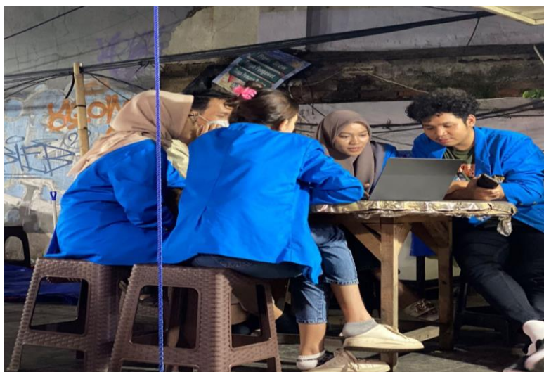
Gambar 10. Praktik Pembukuan

Setelah melaksanakan sesi wawancara, pada keesokan harinya kami kembali ke lokasi untuk melakukan praktik lebih mendalam terkait pembukuan dengan menggunakan Aplikasi UKM. Kegiatan ini bertujuan untuk memberikan panduan praktis kepada pelaku usaha terkait penggunaan aplikasi tersebut dalam menyusun dan mengelola catatan keuangan UMKM dengan lebih rinci.