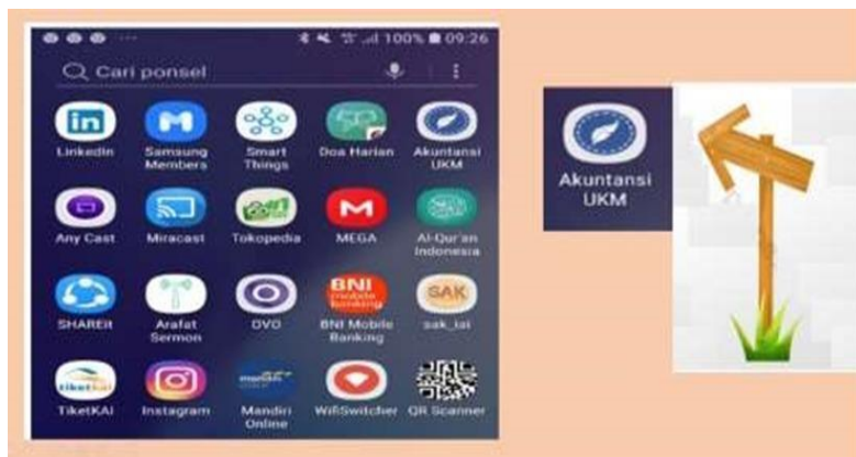
Gambar 5. Aplikasi Akuntansi UKM

Untuk mengakses aplikasi Akuntansi UKM, diperlukan pembuatan akun baru yang sesuai dengan jenis usaha yang dimiliki. Proses pembuatan akun ini menjadi langkah penting sebagai identifikasi pengguna dan untuk memastikan bahwa setiap entitas usaha dapat memanfaatkan aplikasi dengan parameter yang sesuai dengan kebutuhan spesifik masing-masing.