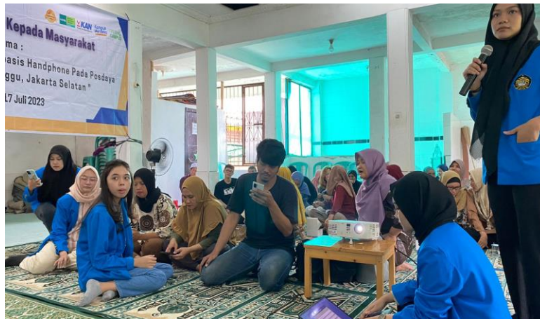
Gambar 3. Praktik Aplikasi Akuntansi UKM

Setelah pemaparan materi, kegiatan dilanjutkan dengan praktik pembukuan melalui Aplikasi UKM yang disediakan oleh perwakilan masing-masing Usaha Mikro, Kecil, dan Menengah (UMKM).