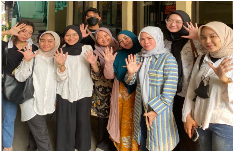
Gambar 1. Observasi Posdaya Kasih Ibu

Kami dari kelompok 6 telah melaksanakan pengabdian kepada masyarakat/ Kuliah Kerja Nyata pada tanggal 17 juli 2023 secara offline di Posdaya Kasih Ibu, Pasar Minggu, Jakarta Selatan, sebelum melaksanakan KKN ini kelompok 6 sudah mengobservasi Posdaya Kasih Ibu terlebih dahulu.