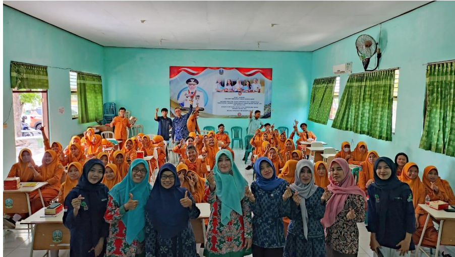
Gambar 2. Penutupan Kegiatan Pengabdian Kepada Masyarakat di SMK PGRI 2 Kertosono

Sesi terakhir ialah evaluasi, yang bertujuan untuk mengetahui sejauh mana keberhasilan kegiatan yang telah dilakukan dan memberikan door prize kepada peserta yang mampu menjawab pertanyaan yang disampaikan oleh tim.