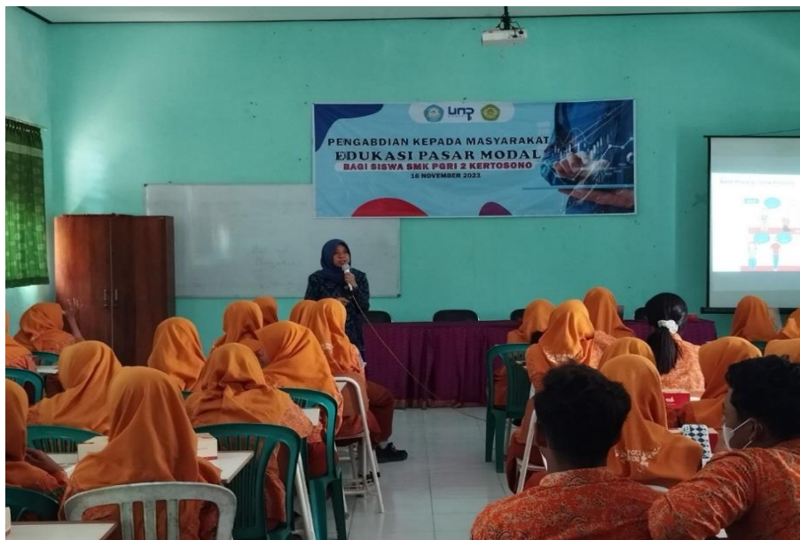
Gambar 2 Penyampaian Materi Oleh Tim Pengabdian

Sesi pertama adalah menyampaikan materi edukasi pasar modal, dalam hal ini dijelaskan mengenai peran pasar modal, pihak-pihak yang berkaitan dengan pasar modal, instrument yang ada dalam pasar modal, hingga bagaimana melakukan analisis saham untuk menentukan pilihan berinvestasi.